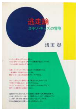
浅田彰「逃走論」 1984年 筑摩書房 装幀：原田治