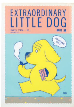
「EXTRAORDINARY LITTLE DOG」 作品集 1981年 PARCO出版