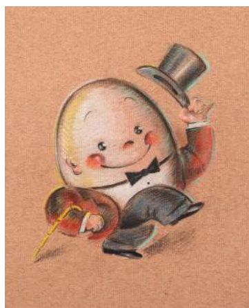
HUMPTY DUMPTY (OSAMU GOODS用原画) 1970年代後半-1980年前半