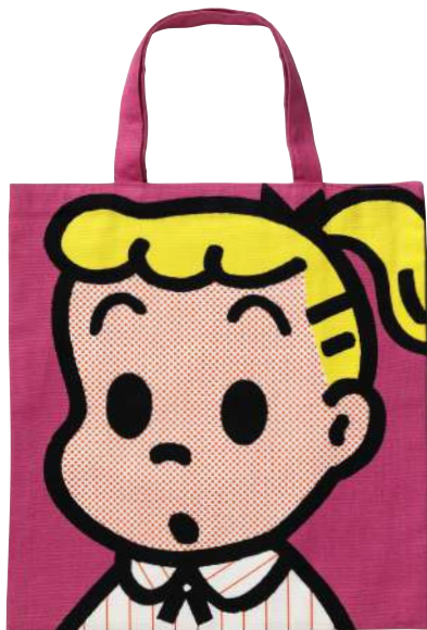
スクールバッグ (OSAMU GOODS®) 1992年 ©Osamu Harada / Koji Honpo