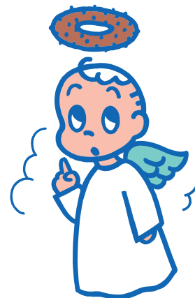
ミスタードーナツ キャンペーン用キャラクター 1986年