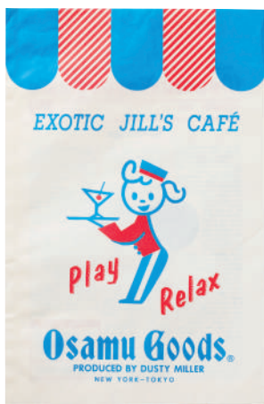
ショップバッグvol.47 (OSAMU GOODS®) 1989年 ©Osamu Harada / Koji Honpo