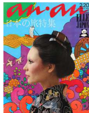
「an·an」第47号 1972年 平凡出版 アートディレクション：堀内誠一 表紙イラストレーション：原田治