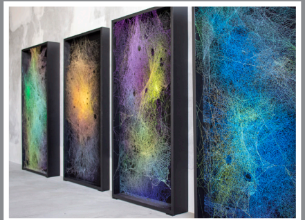
1. 雨のうた 2. マジックアワーのモビール(仮称)展示イメージ 3. シークレットガーデン 4. プワンプ 5. Network_モニュメント_風景 表面, Lifelog_ジャンデリア